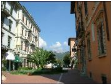
Montecatini mit Montecatini Alto

Und wieder ein Ruhetag, ungeplant, aber unvermeidlich. Dem Mistwetter fällt die Tour nach Barga mit vielen vielen Höhenmetern zum Opfer. Statt dessen machen wir in Kultur: vormittags Besichtigung der vielen Thermen und Caffee-bars, nachmittags mit der Standseilbahn hoch nach Montecatini Alto. Dort feiern Dorf und Besucher ein Fest zu Ehren des Knoblauchbrotes, der "fett'unta".