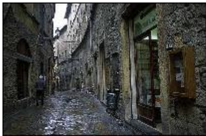
Haben wir gesehen (Volterra, touristenfrei)

Die Frühheimkehrer indes beschließen, mit den Autos nach Volterra zu fahren. Dort ist es menschenleer, na ja, es regnet ja noch immer. Auf den Zieleinlauf des "giro della Toscana femminile" verzichten wir - trotz allem Respekt vor den tollen Leistungen der Mädels.