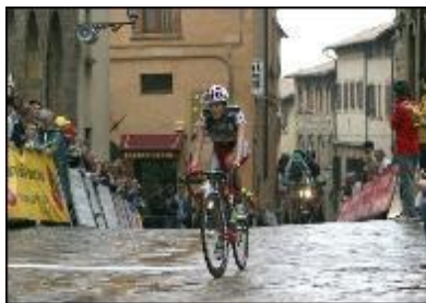
Haben wir beinahe gesehen