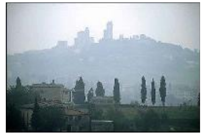
Haben wir nicht gesehen (San Gimignano)