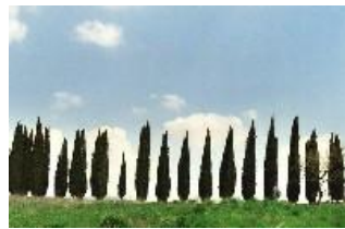
Toskana im September 2006

Für den 12. bis 18. September 2006 waren 6 Touren mit insgesamt 614 km geplant. Verteilt auf 2 Standorte, d.h. es war keine Etappenfahrt.