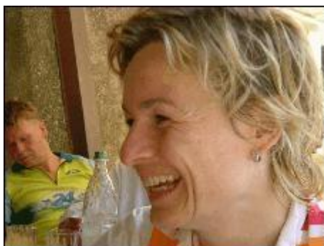
Eine kleine Pause wirkt Wunder