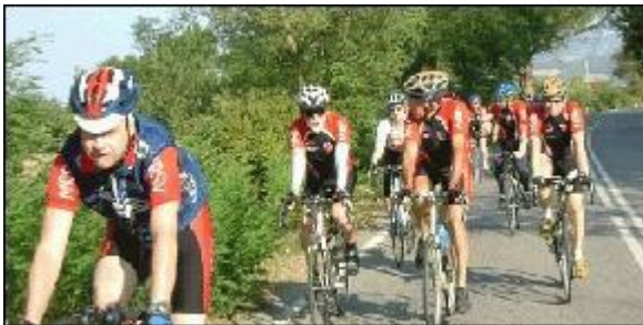
Da war's noch sonnig

Bis Pistoia ist lockeres Einrollen angesagt, dann geht es schlagartig bergauf, ca 10 km bis auf 800 m Höhe. Dann etwas runter, locker rollen lassen, denn gleich geht's wieder hoch. Nach dem Passo dell'Oppio dann rasante Abfahrt nach San Marcello Pistoiese.